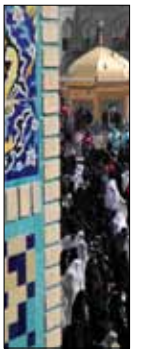
۱۷ سال بعد از آغاز «طرح بهسازی و نوسازی بافت فرسوده اطراف حرم رضوی»، خانه‌های قدیمی و بافت فرسوده‌ای که زمانی تنها محل اسکان زائران کم‌درآمد بودند، اندک‌اندک تخریب شده و جای خود را به بناهای بزرگ و چند طبقه دادند

از اینجای کار به بعد، طرح تازه‌ای ارائه شد که سهمی هم برای آن ۷۰ درصد قائل می‌شد. بعد از مطالعات جامع چندین ساله که همه جوانب زیارت زائران را پوشش می‌داد، اولین گام برای